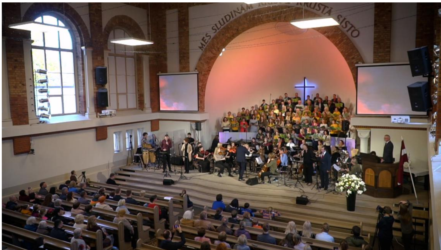
Kopskats: Oratorijas „Dieva Skarts” izpildītāji un daļa klausītāji

bija pielūgsmes vakars, bet sestdienā 22.oktobrī - konference. Svētdien, 23.oktobrī notika galvenais, - noslēguma dievkalpojums.