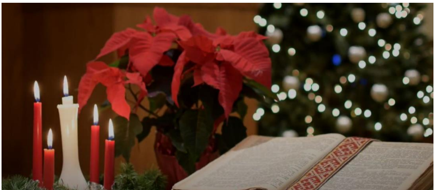
Skats Bukskauntijas draudzes dievnamā