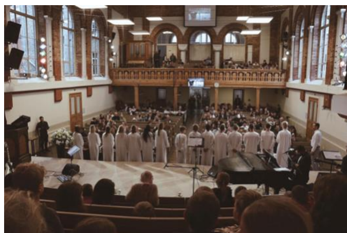
Kristību kandidāti—skats no kora vietas uz kristības

Saite uz video: https://www.youtube.com/watch?v=4eXy9Pqg1eo&t=385s