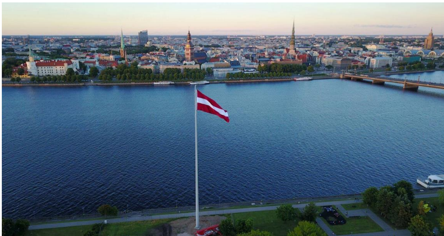
Latvijas karogs pie Daugavas upes. Otrā upes pusē Vecrīga