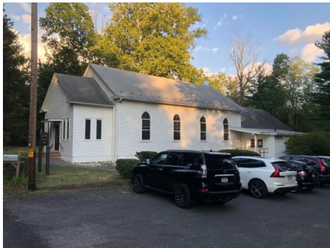
Bukskauntijas draudzes dievnams

A) Varbūt jūs jautāsiet: “Kas tam, kas līdz šim sacīts, ir kopīgs ar apceŗamo Rakstu vietu no Lūkas evaņģēlijā, kur Jēzus māca Saviem mācekļiem par to, kā viņiem būs lūgt.” Mūsu svētrunas virsraksts ir: Čūska, zivju vietā . Tā nāk no Rakstu vietas vārdiem: “Vai starp jums ir tēvs, kas dos dēlam čūska, ja tas lūdz zivi? Vai skarpiju, ja tas lūgs olu? Ja nu jūs, samaitāti ļaudis, zināt dot saviem bērniem labas dāvanas, Cik daudz vairāk mūsu Tēvs no debesīm dos Svēto Garu tiem, kas Viņu lūdz?” (Lūkas ev.