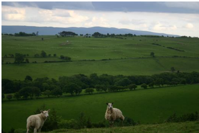
Aitas ganībās Velsā

Labais Gans ved pie dzīvības ūdens avotiem, pie