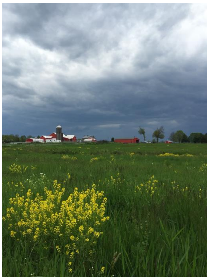
Bukskauntijas lauksaimniecība netālu no draudzes dievnama