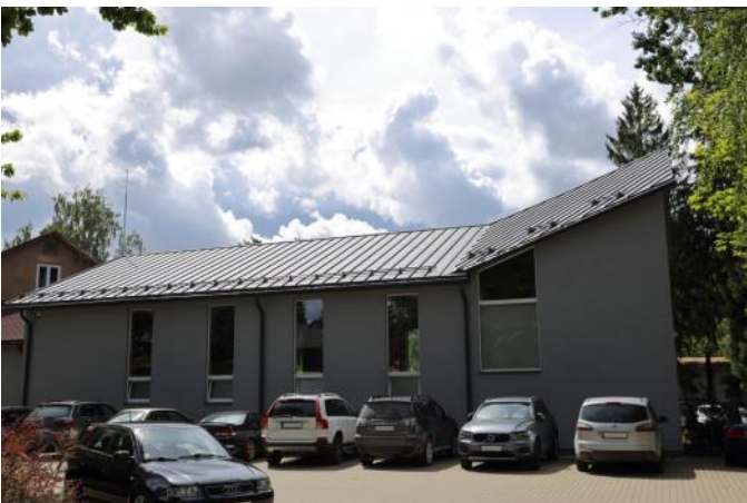
Ogres baptistu draudzes dievnams

Mācītājs ziņo par draudzes kopīgo apņemšanos izlasīt un pārdomāt visu Marka evaņģēliju laikā līdz Kristus augšāmcelšanās svētkiem. Šis svētdienas lasījums samērā garš (Mark.1:16 -2:17,) tāpēc mācītājs aicina klausītājus nepiecelties, kā to dara parasti, bet palikt sēdot, lai nebūtu jādomā, kad varēs atkal apsēsties, un lai tā vietā varētu uzmanīgāk klausīties, kas tiek lasīts. Tekstā aprakstīti vairāki notikumi, bet runātājs īpaši apstājas pie notikuma, kad Jēzus dziedina spitālīgo. Vecās Derības laikā lepras vai spitālības slimnieku bija daudz, īpaši zemēs ap Vidusjūru, tie tika dēvēti par nešķīstiem, pakļauti stingrai izolācijai. Mūsu dienās un mūsu zemē lepras gadījumi sastopami reti, jo ir antibiotikas un atšķirīgs, labāks dzīves līmenis un higiēna. Runātājs atceras dažus iespaidus no redzētā kādā leprozorijā viņa zēna gados, dzimtajā vietā Vidzemē. Pirmkārt jāpievērš uzmanība spitālīgā pazemīgajai lūgšanai : “Kungs, ja Tu gribi, Tu mani vari šķīstīt!” Jēzus aizkustinājumā tam pieskārs un atbildēja: “Es gribu, topi šķīsts!” Līdz ko Viņš to teica, spitālība no slimā vīra pazuda, un tas tapa šķīsts. Tālāk vecajā