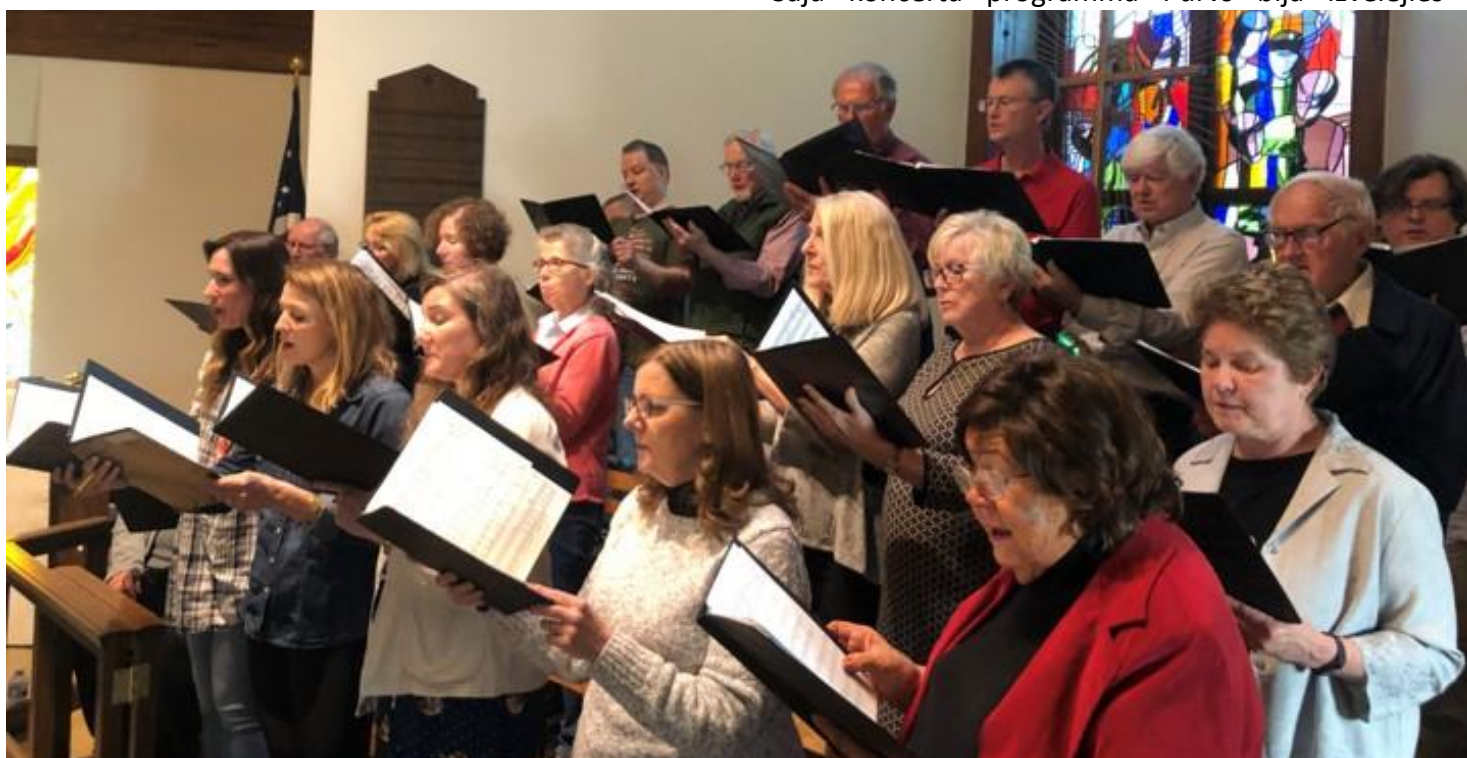
Dziesmu dienas koris Filadelfijā 2019. g.—mēģinājumā