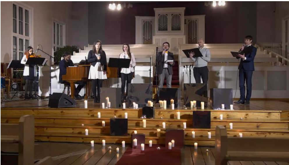
Golgātas Ziemassvētku ansamblis 2020

Rīgas baptistu Golgātas draudzes dievkalpojumu ievadīja divu izcilu mūziķu kopēja improvizācija par Kristus dzimšanas svētku dziesmu