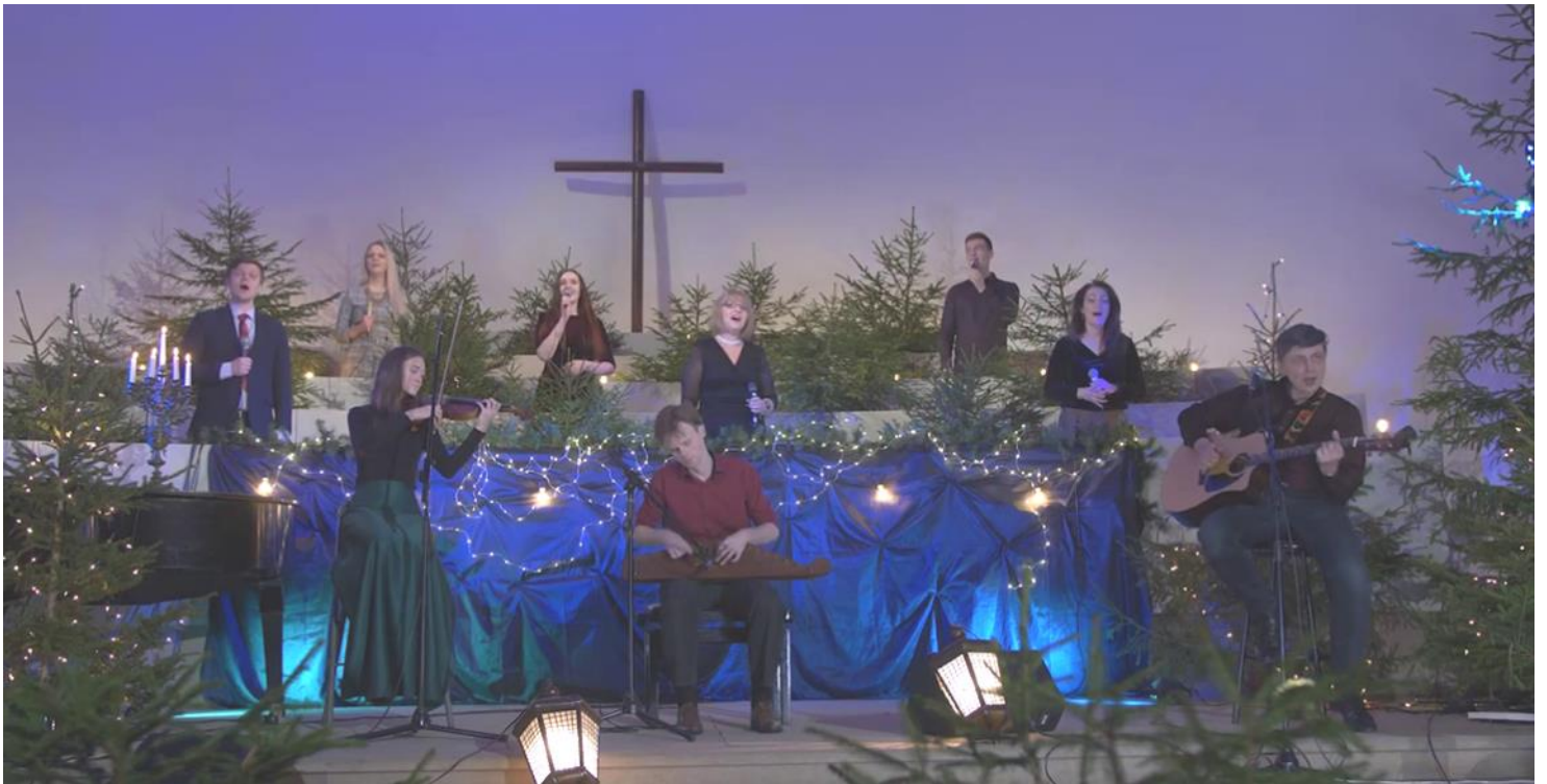
Mateja draudzē Ziemsvētku svētvakars