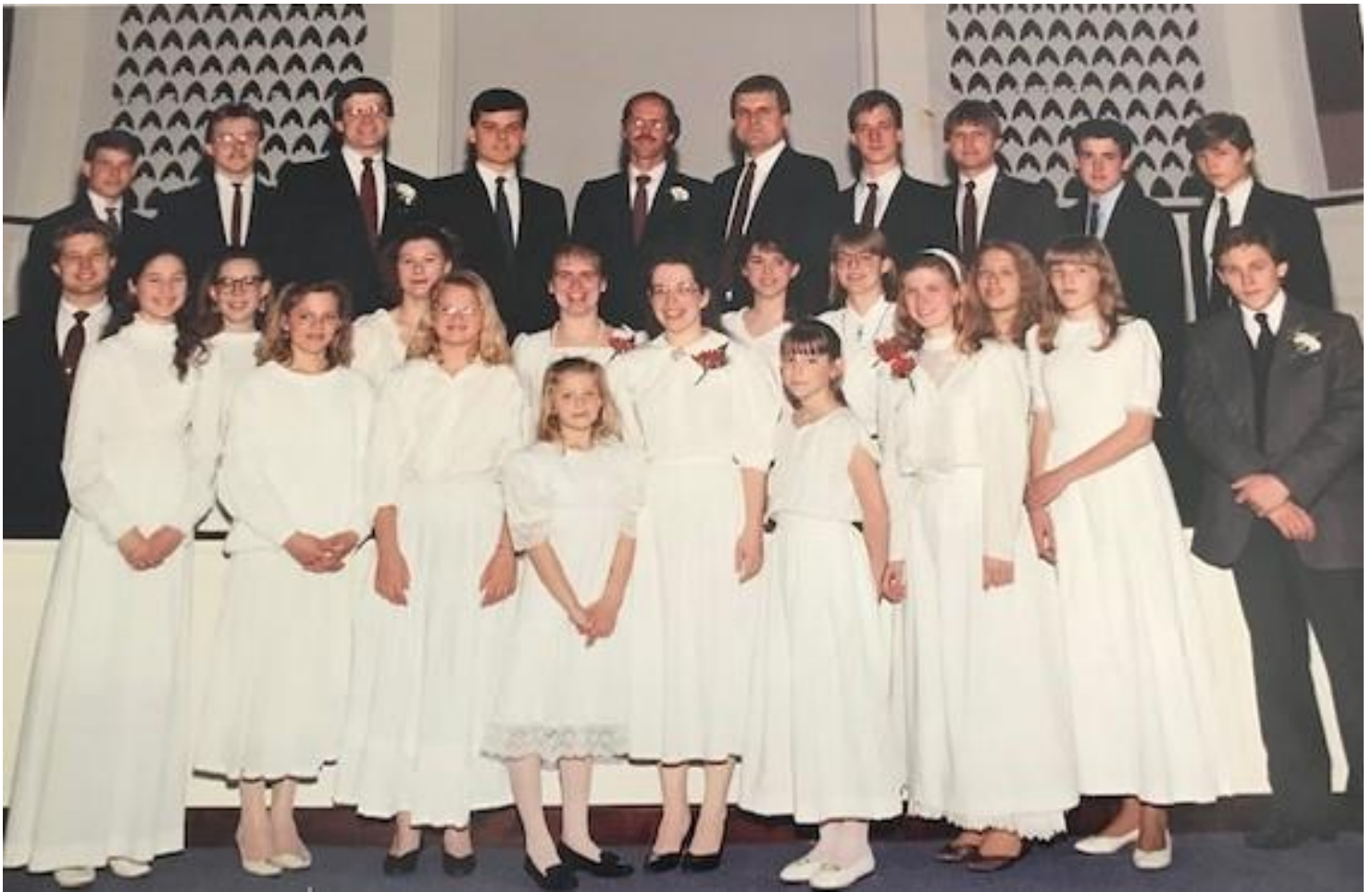
Jaunatnes koris 1989. g. Filadelfijā