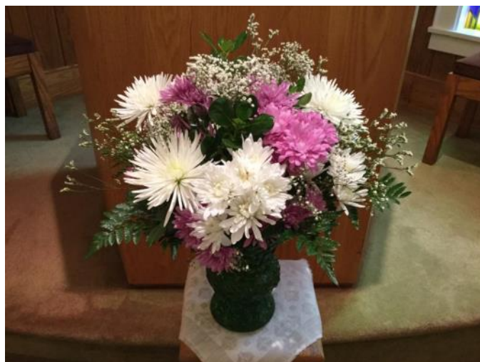
Ziedi Valentīna un Faniņas Stūrmaņu piemiņai

Benita Ukstiņa