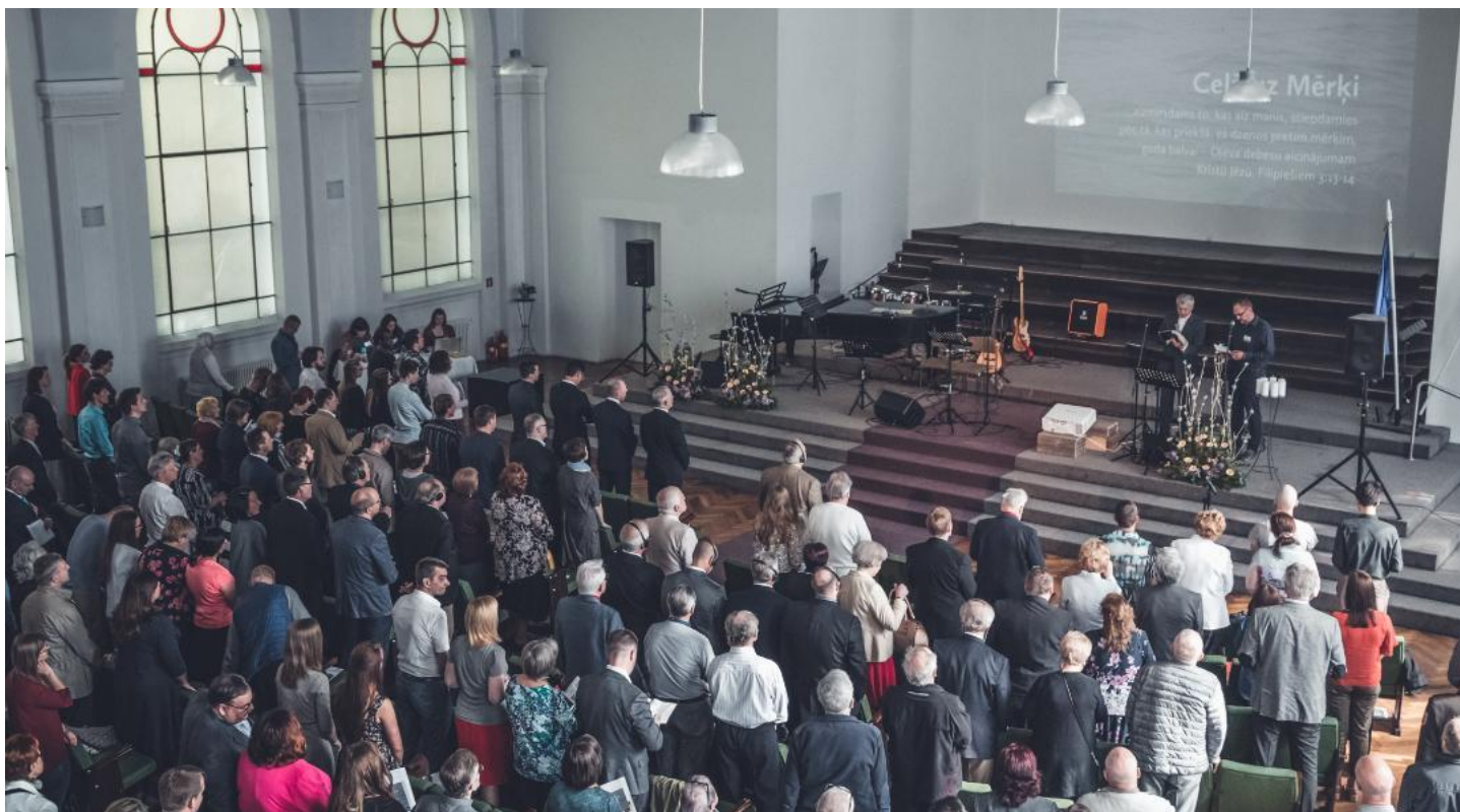
Kopskats zālē: dalībnieki, kongresu atklāšanā.