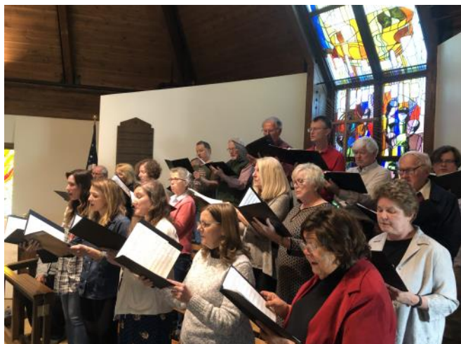
Koris sestdienas mēģinājumā

ALBA Koŗu apvienības rīkotā 70. Dziesmu diena