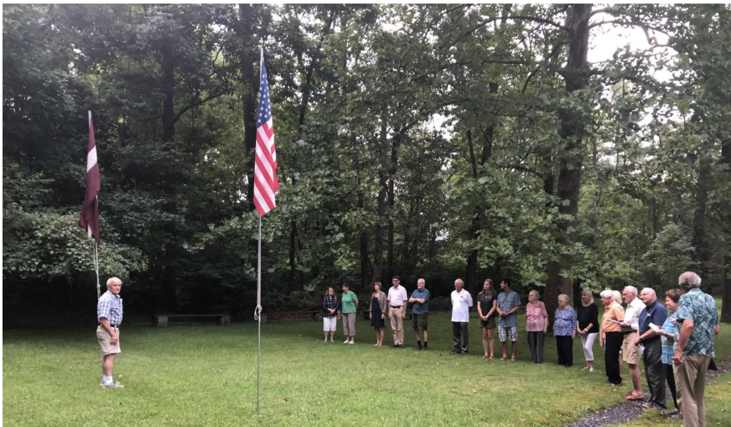
Skats no pagājušā gada kongresa dienām.