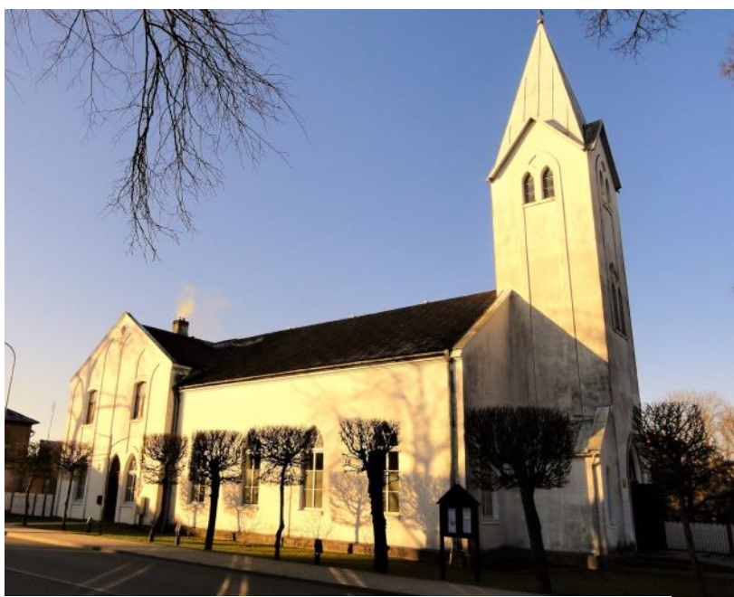
Talsu baptistu draudzes dievnams

Tajā pašā laikā kāds populārs, lai neteiktu “bēdīgi slavens” vīrs no Padomju valsts un komunistiskās partijas vadītājiem paziņoja, ka ar reliģiju “iet uz beigām” un pēc neilga laika, lai televīzijas ekrānos parādītu, vajadzēšot sameklēt tādu retumu, kā vēl atlikušu kristīgi ticīgu cilvēku. Bet tā ir savā ziņā “likteņa ironija”, ka ir noticis gluži pretējais. Tagad valsts televīzijā regulārās tiešraidēs var noskatīties un noklausīties kristiešu dievkalpojumus.